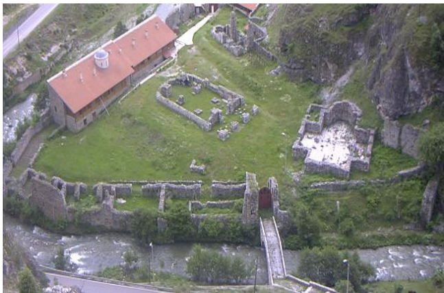
Манастир Свети Архангели Призрен